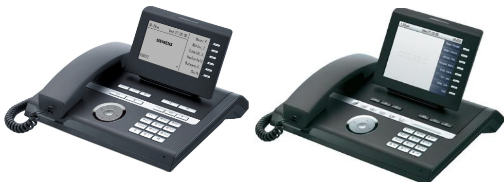
Abbildung 4: OpenStage 40 und OpenStage 60

Eine Anleitung für die Benutzung des OpenStage finden Sie auf den Webseiten der IT.SERVICES unter "Downloads & Anleitungen".