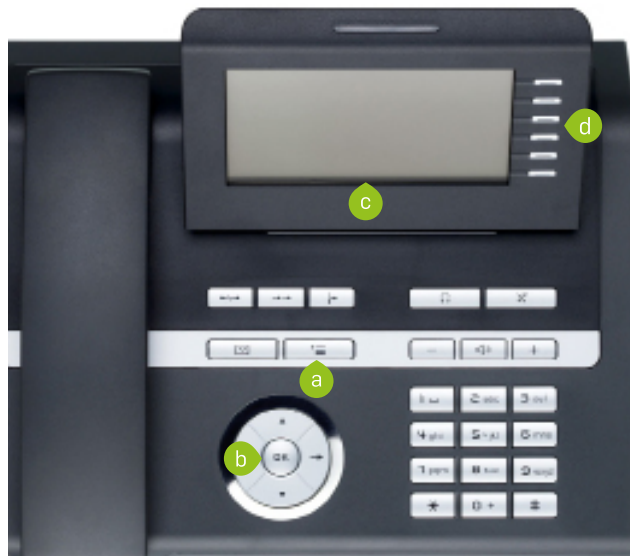
Abbildung 5: Bedienfeld OpenStage 40