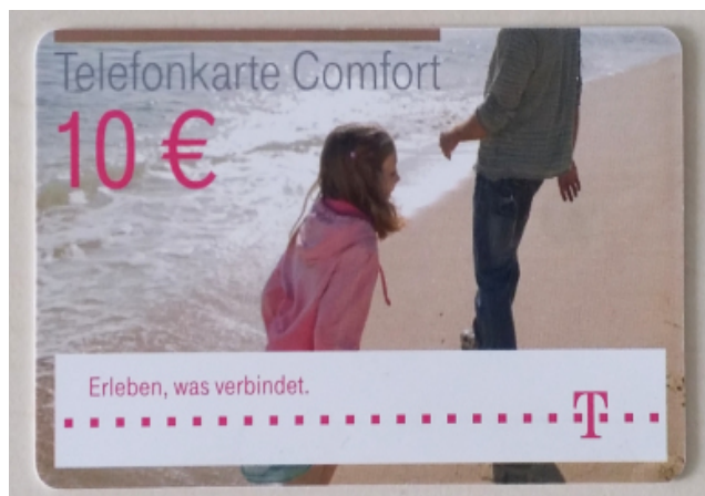
Abbildung 1: Calling-Card „Telefonkarte Comfort“

Calling-Cards gibt es von verschiedenen Anbietern (z.B. Deutsche Telekom, simmini, Woopline).