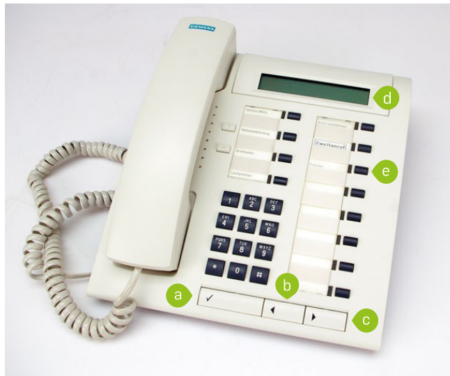
Abbildung 3: Siemens optiset

Eine Anleitung für die Benutzung des optiset finden Sie auf den Webseiten der IT.SERVICES unter "Downloads & Anleitungen".